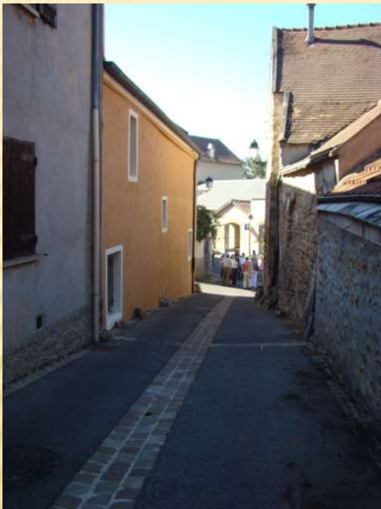
La rue qui mène à l'église Saint Clair