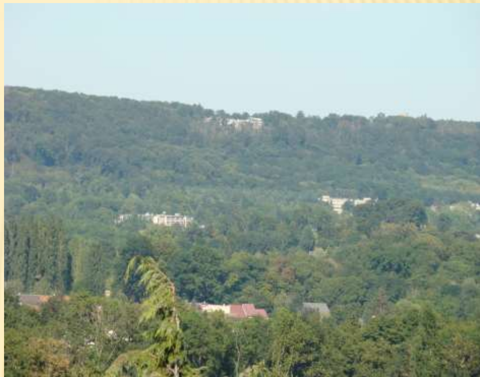
Vue du coteau de la Hacquinière